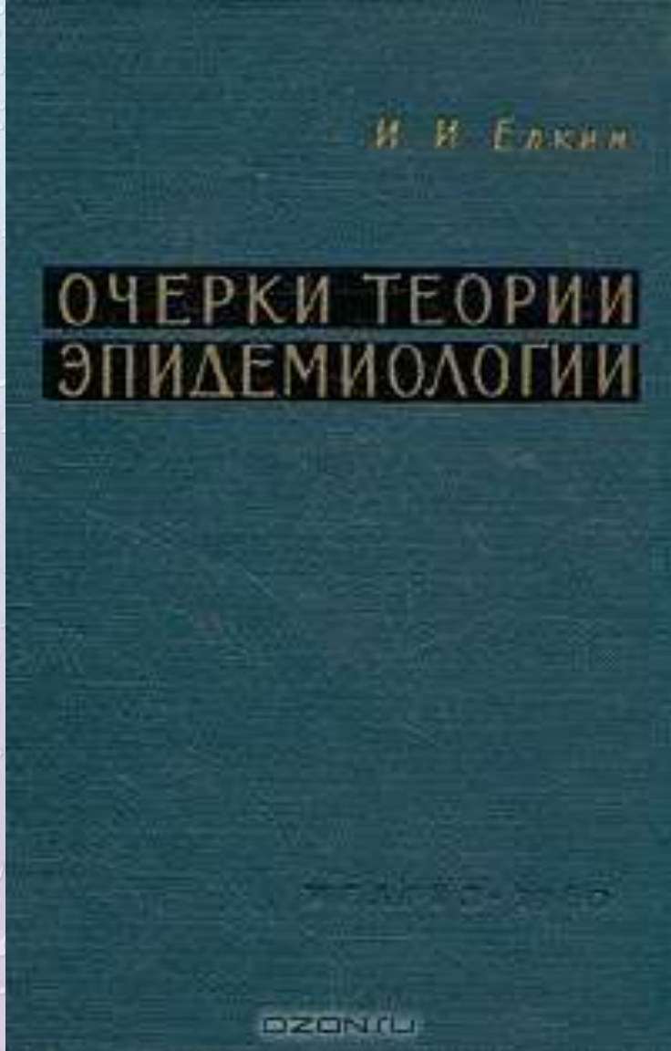
«Очерки теории эпидемиологии» (1960)