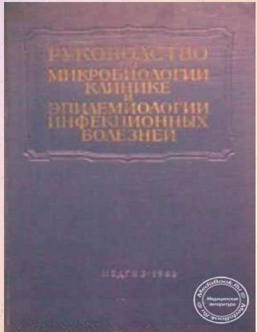
Многотомное руководство по микробиологии, клинике и эпидемиологии инфекционных заболеваний: Том 5, И.И. Елкин, 1965 г